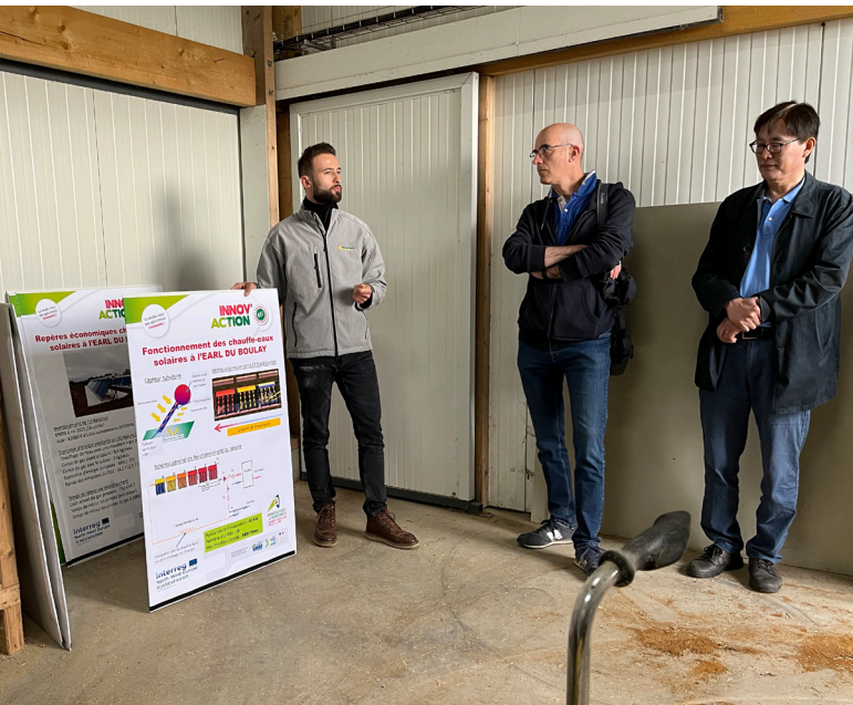
Présentation FengTech lors de la journée portes ouvertes Innov'Action sur le site pilote